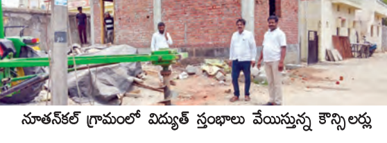
నూతనకల గ్రామంలో విద్యుత్ సౌకర్యాల వేయిస్తున్న కౌన్సిల్