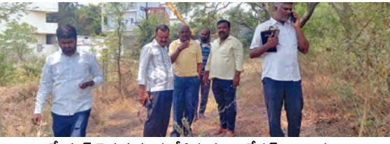
మేడ్చల్ చెరువును పరిశీలిస్తున్న ఇరిగేషన్ అధికారులు

మేడ్చల్, మే 16, ప్రభాతవార్త : ఎల్లంపేట మున్సిపాలిటీ పరిధి నూతనకల గ్రామంలోని 16వ వార్డు, 21వ వార్డుల్లో నెలకొన్న నీటి, కరెంటు సమస్యలను ఆ వార్డుల కౌన్సిల్ లు సురక్షిత, భాస్కర్లకు పరిష్కరించారు. నూతనకల గ్రామంలో గత కొంతకాలంగా ఉన్న నీటి సమస్యను వారు దగ్గరలో పని చేయించి నీరు వచ్చే విధంగా చేశారు. అదే విధంగా కరెంటు సమస్యను అదే కరెంటు ఇంజనీరులు ఉండగా స్వంత ఖర్చుతో ఆ సమస్యను కూడ పరిష్కరించారు. దీంతో గ్రామస్థులు సంతోషం వ్యక్తం చేసి కౌన్సిల్ లను అభినందించారు.