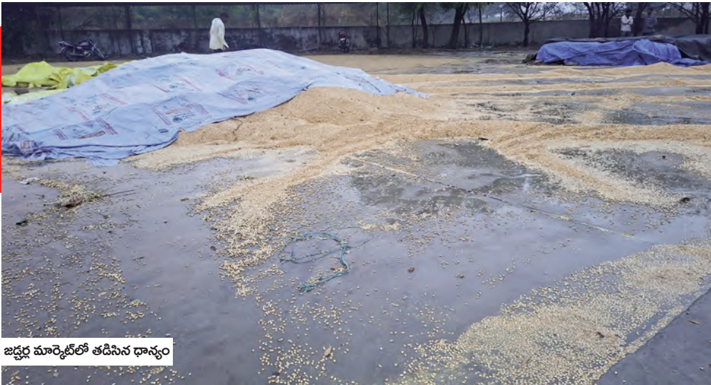
జడ్చర్ల మార్కెట్లో తడిసిన ధాన్యం

వడ్లతో పాటు మక్కలు పెద్ద ఎత్తున తడిసి ముద్ద అయ్యాయి. వందల కింగులలో ధాన్యం నేలపాలు కావడంతో అన్నదాతలు లబోదిబోమంటున్నారు. ధాన్యం మార్కెట్ యార్డుకు తీసుకువచ్చి నేల రోజులకు పైగా ఆవుతుంది అని, తూకం చేసిన ధాన్యం ఏంపుకోవడానికి గోదాంలో జారా లేదని చూచుతుంటే అని అధికారులు నిరక్ష ధర్మ వహించడంతోనే నేడు ఈ దుస్థితి ఏర్పడిందని రైతులు ఆవేదన వ్యక్తం చేస్తున్నారు. సమయానికి ధాన్యం కొనుగోలు చేసి గోదాములలో నిల్వ చేసి ఉంటే ఈ దుస్థితి వచ్చేది కాదన్నారు. తడిసిన ధాన్యాన్ని ప్రభుత్వం ఎలాగైనా కొనుగోలు చేయాలని రైతులు కోరుతున్నారు.