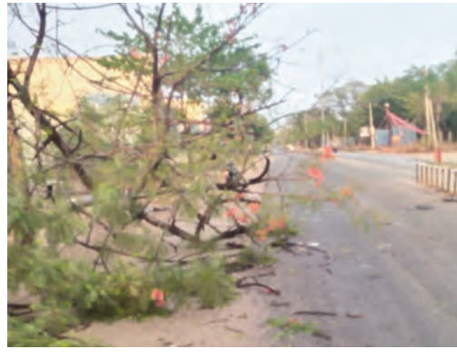
అత్తకూరు అమరచింత ప్రధాన రహదారిపై విరిగిపడ్డ చెట్లు

మండలంలోని వివిధ గ్రామాలలో గాలివాన విభజనానికి విద్యుత్ తీగలు మరియు విద్యుత్ స్తంభాలు నేల కొండంతో అధికారం ఏర్పడింది. మార్కెట్ యార్డు ఆవరణలో తడిసిన వరి ధాన్యాన్ని అధికారులు ఎలాంటి పరతులు విధించకుండా కొనుగోలు చేయాలని ఇప్పటికే కొనుగోలు చేసిన ధాన్యం కూడా తక్షణమే తరలించేందుకు ఏర్పాట్లు యుద్ధ ప్రాతిపదికన చేయాలని వలు రైతులు విజ్ఞప్తి చేస్తున్నారు.