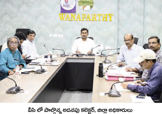
వీసీ లో పాల్గొన్న అదనపు కలెక్టర్, జిల్లా అధికారులు