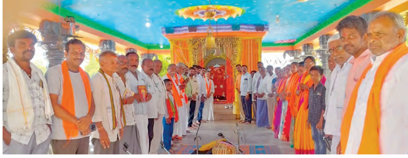
అంజనేయస్వామి ఆలయంలో పూజలు చేస్తున్న భక్తులు